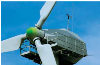
Der 65-Kilowatt-Prototyp des kanadischen Start-ups CWind

CWind will so in seinen 65-Kilowatt-Prototypen die Effizienz um bis zu fünf Prozent gegenüber herkömmlichen Turbinen gesteigert haben. Die Wartung ist erheblich preiswerter. T. HAMILTON